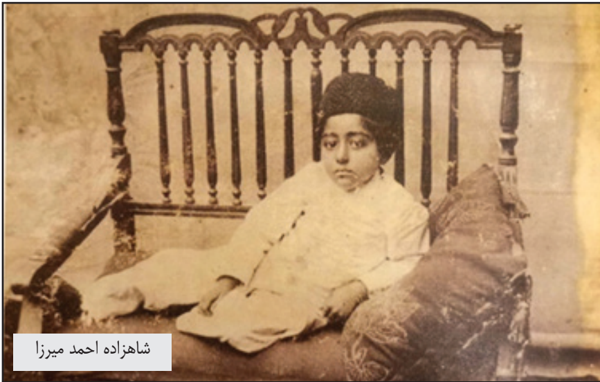
شاهزاده احمد میرزا