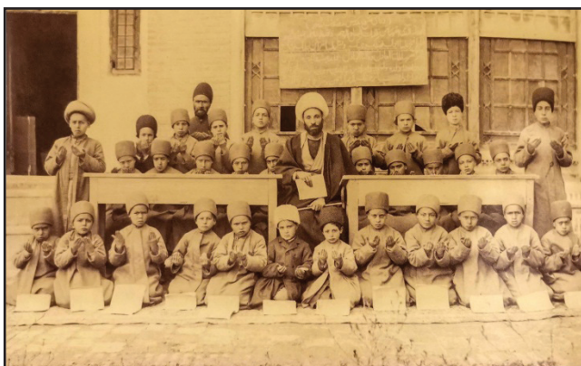
عکس ۴. زیبای‌شناسی بومی مدارس

اما فضا و صحنه زیبا برای ثبت عکس نیز تابع ساختار فرهنگی، اجتماعی و اقتصادی است. فضا سازی طبقه مرفه در عکس‌ها شبیه الگوهای غربی است که برخی در باغ یا استودیوها عکاسی شده‌اند، اما در مورد طبقه عام که عکاس به سراغ آن‌ها رفته و در فضایی که آنان زندگی می‌کنند، عکاسی کرده و اغلب فضا سازی خاصی انجام نشده است. برخی از عکس‌ها نیز در فضاهای آموزشی مانند مدارس نوین و مکتب‌خانه‌ها به ثبت رسیده‌اند. کودکان در عکس‌ها در حالت سکون و بی‌حرکتی به نمایش گذاشته شدند، این مسئله دستخوش عواملی همچون گرانی ابزار ثبت عکس و تعریف عکس واضح به عنوان عکس مطلوب است. مدارس کپی‌برداری از سیستم غربی و سنتی نیز از نظر خودتزیینی متفاوت است، مدارس نوین غربی تحت تأثیر خودتزیینی غربی است که در عکس مشهود است، در حالی که مدارس از خودتزیینی سنتی بهره می‌برند و همین مسئله بیانگر پیروی