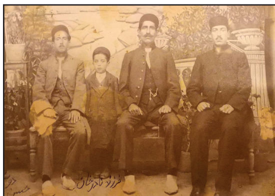
عکس ۳. بزرگسالان کوچک