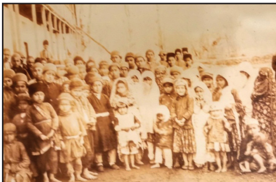
عکس ۲. کودکان طبقه عام